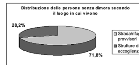
(Grafico n. 1)

Riprendendo il totale delle persone definite senza dimora (128), la distribuzione secondo la tipologia del luogo in cui passano la notte è, dunque, di 92 (71.8%) in strada/rifugi provvisori e di 36 (28.2%) in strutture di accoglienza. Il primo dei due dati sale ulteriormente considerando che le persone che non sono potute rientrare in questo conteggio, perché non incontrate la notte campione, risiedono tutte in strada/rifugi provvisori.