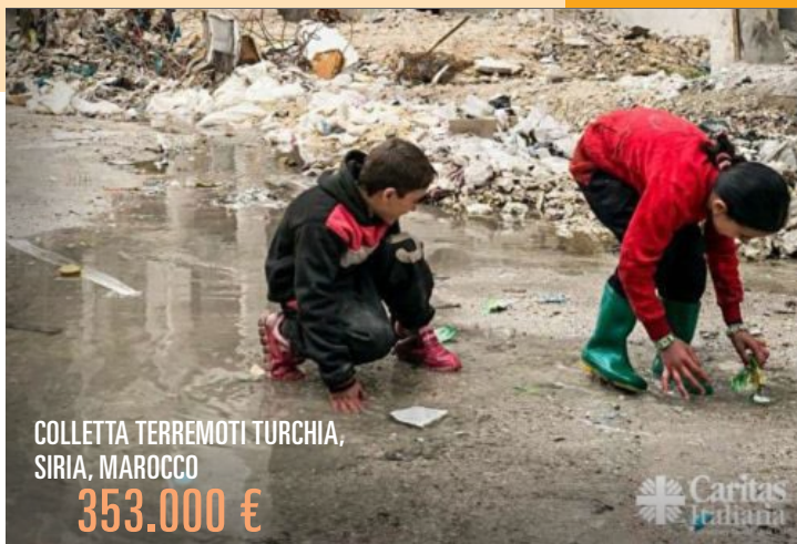
COLLETTA TERREMOTI TURCHIA, SIRIA, MAROCCO 353.000 €

L'area internazionale ha inoltre partecipato attivamente all'organizzazione del Mese della Pace 2023 con altre realtà del territorio, organizzando diversi eventi di sensibilizzazione tra cui